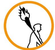
Cultura i Patrimoni