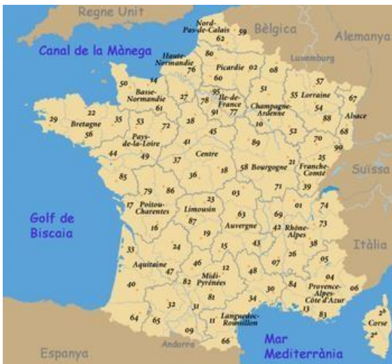
Imagen: Los departamentos

El país está subdividido en 99 departamentos . Cada departamento es administrado por un consejo departamental ( conseil départemental ), que se elige cada seis años. El número de cada departamento se corresponde con la posición de su nombre en el orden alfabético. Este número lo encontramos también en las matrículas de los vehículos.