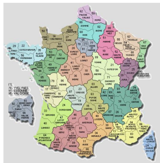
Image : Es tretze arregions i es 99 francesas