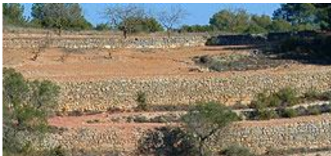
Imatge: Marge de pedra seca

Despedregar va constituir durant diverses generacions un treball que omplia de sentit les hores mortes i es traduïa sovint en la construcció de marges i parets. D'aquesta manera es convertien els terrenys en cultivables i es complia alhora amb una triple funció: dividir la propietat, emmagatzemar el pedruscall i, en terrenys inclinats, prefigurar els bancals o esglaonaments que a continuació s'omplien amb terra i esdevenien conreu. En indrets amb predomini de l'arquitectura de la falsa cúpula, l'existència de la cabana o barraca també responia a aquesta necessitat de desproveir el camp de pedra.