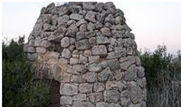
Imatges: Cabana de volta i aljub.