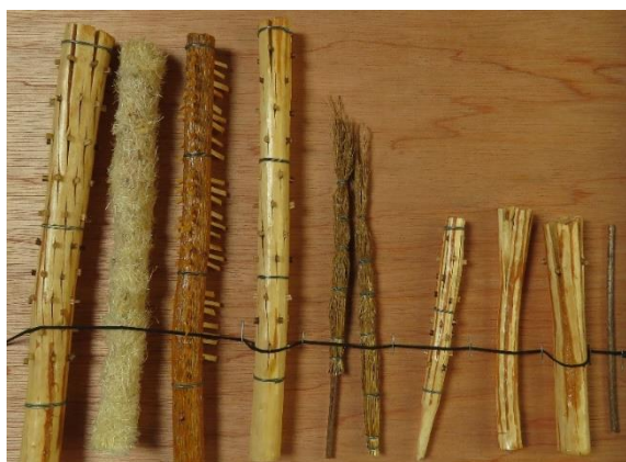
Capsa 1: rèpliques @Pyrart Sebastià Jordà

Apunts interessants: El mànec és de boix. Per motius de seguretat, actualment es fa servir una falla feta de pasta de paper i malla metàl·lica. La festa se celebra a Andorra la Vella, Sant Julià de Lòria, Escaldes-Engordany, Encamp i Ordino. La recuperació de les falles va tenir lloc el 1987.