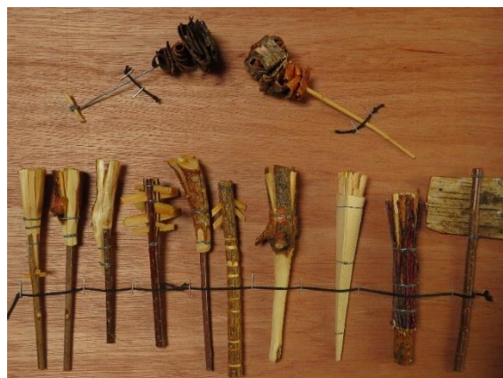
Capsa 2: rèpliques @Pyrart Sebastià Jordà