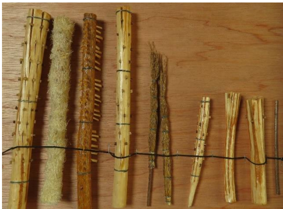
Caisha 1 Repliques @Pyrart Sebastià Jordà