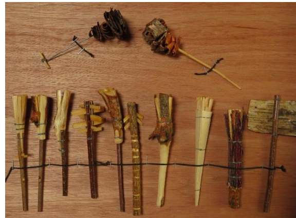
Caisha 2 Repliques @Pyrart Sebastià Jordà